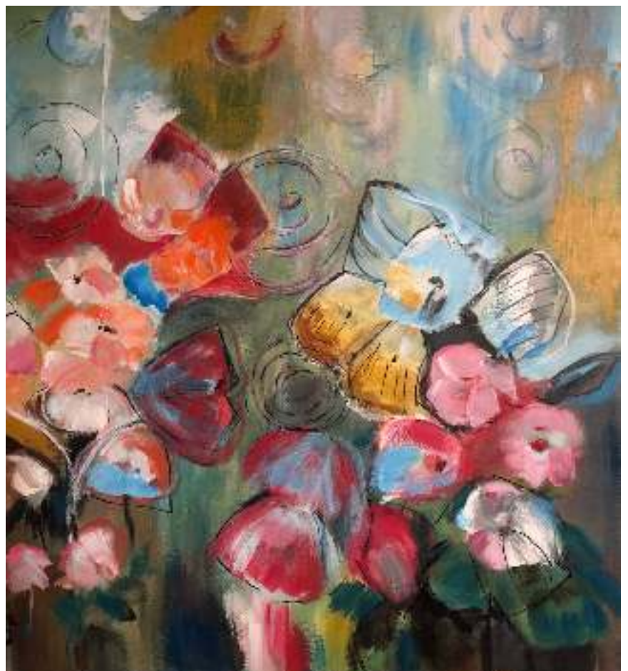
z.t. Annelies Koop acryl op doek (2022)