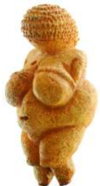
Venus van Willendorf

De Venus van Willendorf is niet enig in haar soort. Op meerdere plekken op de wereld zijn dergelijke “moedergodinnetjes” aangetroffen. Tijdens TEFAF zag ik er verschillende malen een in de vitrines van Mieke Silberberg. Wat had ik er graag een gekocht, maar helaas was de beurs niet dik genoeg. Dan zou ik haar doorgegeven hebben aan mijn dochter, als symbool van mijn en haar moederschap.