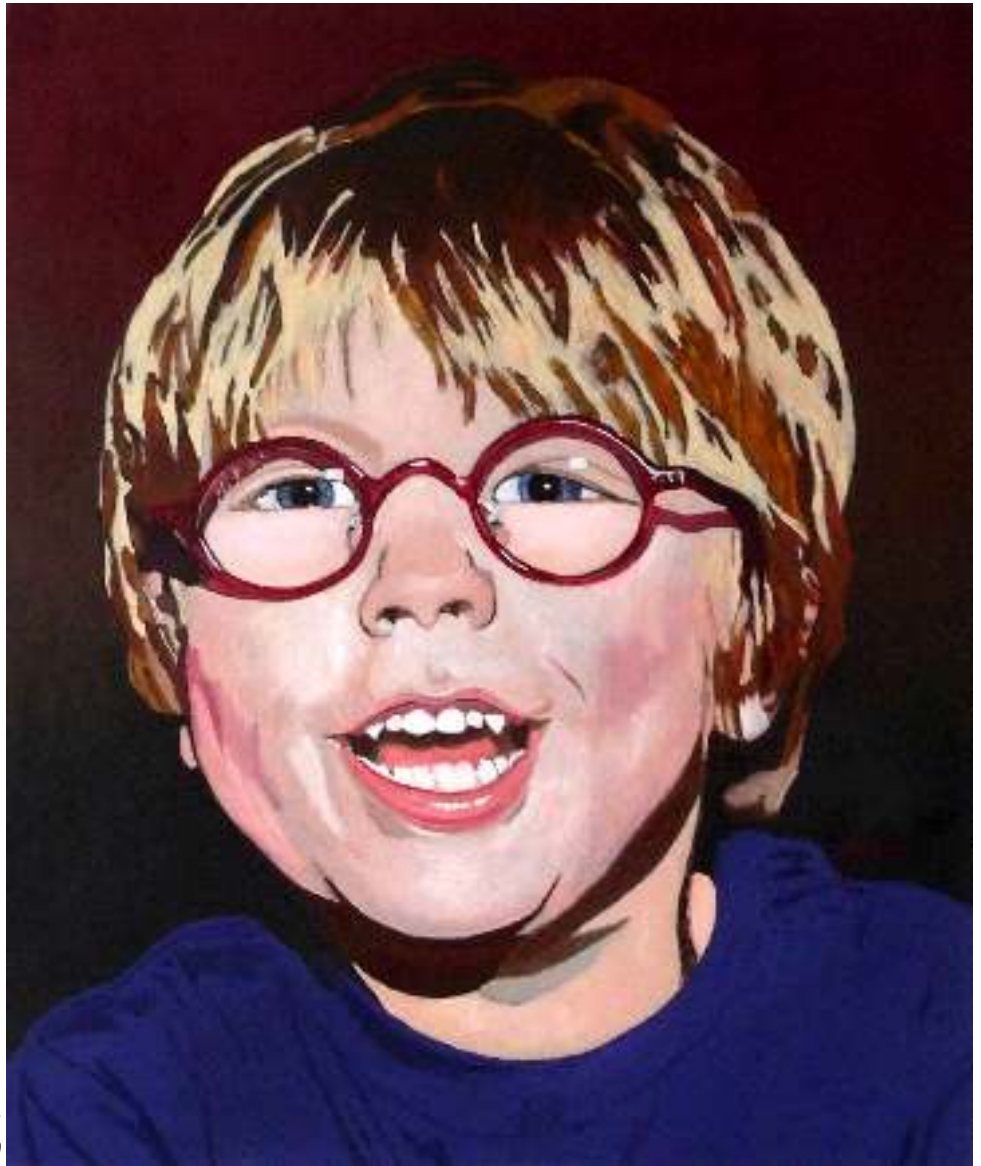
Valentijn, Anton de Joode olieverf op doek, 50x60