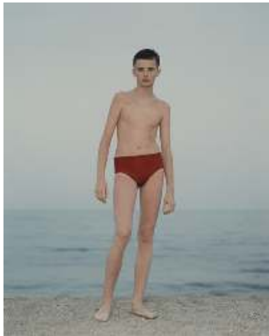
foto van een jongeman gemaakt op het strand van Odessa, Oekraïne. De jongen staat in een beetje ongemakkelijke houding, met alleen de zee als achtergrond, ons aan te kijken. Heel mooi, vind ik, hoe Dijkstra hier de onzekerheid en kwetsbaarheid van een jong mens in beeld brengt. Ontroerend!

Voor deze gelegenheid heb ik gekozen voor een van Dijkstra's "strandportretten". Het is een