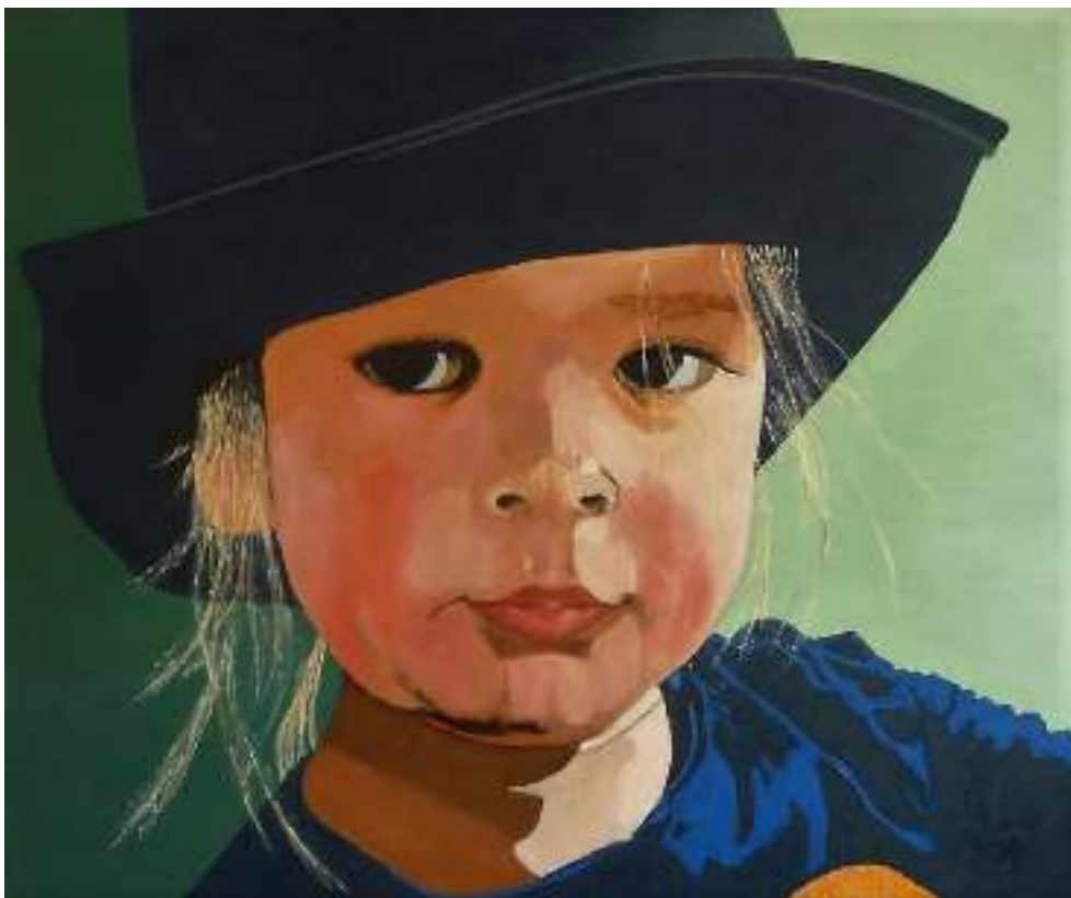
Tessa, Anton de Joode olieverf op doek, 60x50 cm