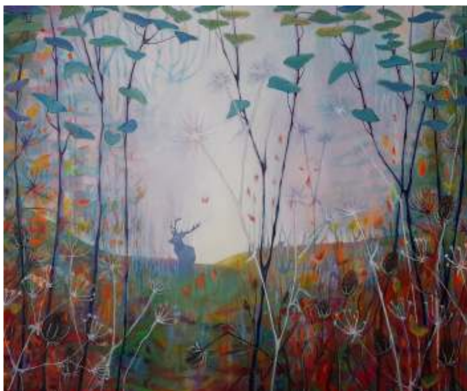
Zomerochtend Anne Barneveld 114x94, 2021