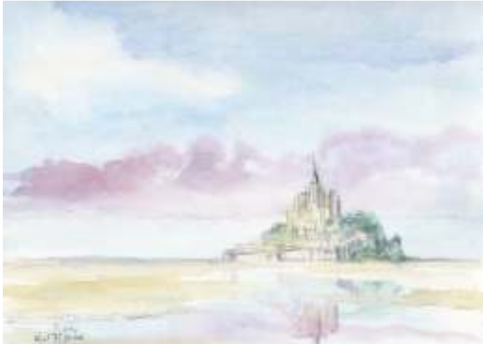
Mont St. Michel (2001)