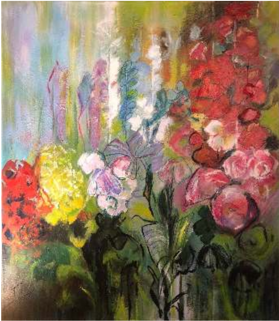
z.t. Annelies Koop acryl op doek (2022)