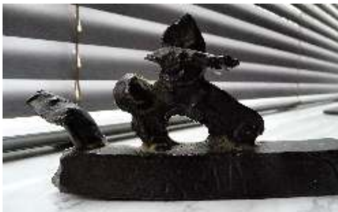
Vikingschip, 2 en een halfjaar oud, brons