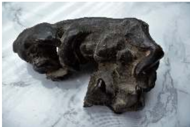
hond, 7,8 jaar, brons

vader. De vader die haar al op zeer jonge leeftijd liet kennismaken met zijn vak, het beeldhouwen. Die haar daarin opvoedde, haar de weg wees, kortom de bron was van wat zij al heel jong had beslist: ook een beeldhouwer te worden. Haar eerste beeldje dat ze op nog geen driejarige leeftijd maakte, werd door hem in brons gegoten. Ze laat het zien en daaruit mag al duidelijk zijn dat het niet anders kon dan dat ze na haar schooltijd naar de Kunstacademie in Maastricht ging. Haar opleiding, die op haar tweede begon, werd hier voortgezet.