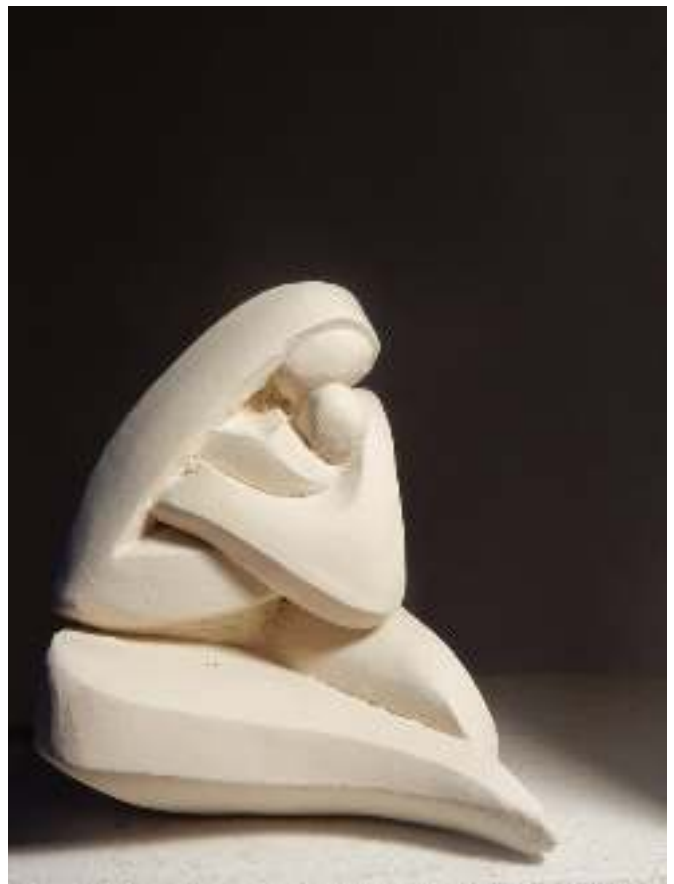
Moeder en kind, 2019, klei

Een verandering die de leden ook opgemerkt moeten hebben is het Ruifvoer. Was het in het begin van de Ruifgeschiedenis een stenciltje, langzamerhand een boekje, dat drie maal per jaar verscheen onder de bezielende en creatieve leiding van Ruud Stegen en nu geworden is tot een zeer fraai