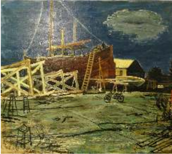
Charles Eyck, Rimini 1972, olieverf op doek

Hollandse kompanen en streden, veelal tevergeefs, voor meer geld, om hun werk aan de man te brengen in een omgeving, waar van een serieuze kunstmarkt nauwelijks tot geen sprake was. In hun ogen bracht Trajecta rijp en groen samen, dat wil zeggen: ook werk van amateurkunstenaars.