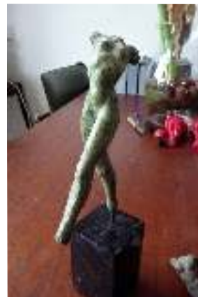
corpus, 13 jaar, brons