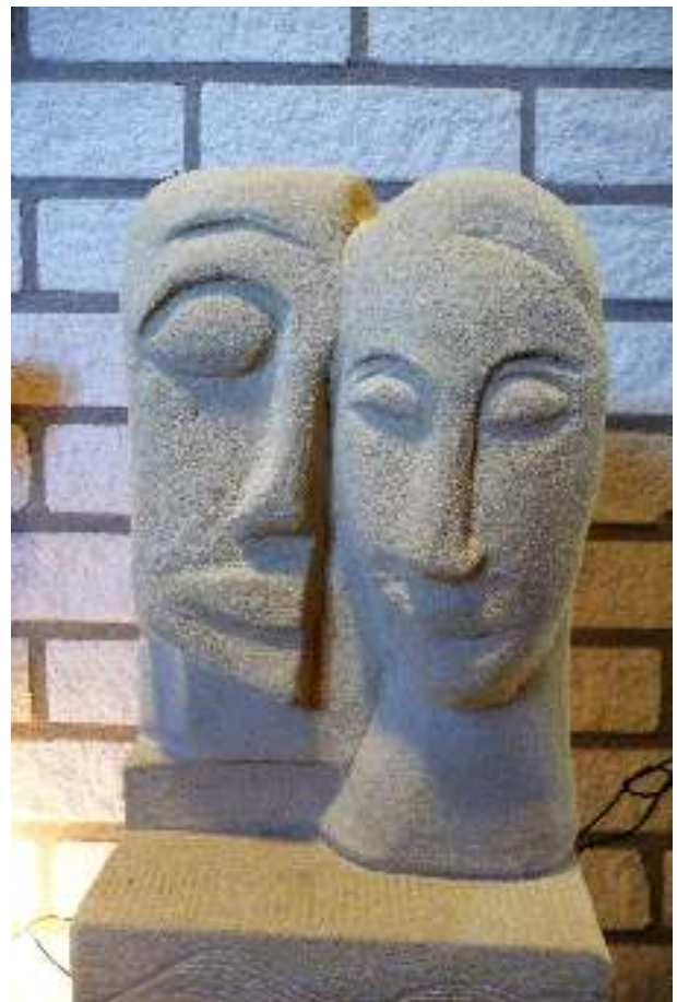
Duo in mergel

Altijd weer was daar De Ruif, de expressiegroep die nog twee keer moest verhuizen, maar wel in haar buurt bleef. Zelf volgde ze naast haar werk in de slagerij nog menige cursus, want in alles wat met kunst te maken had, was (en is!) ze geïnteresseerd. Tientallen exposities volgden, niet zelden bekroond