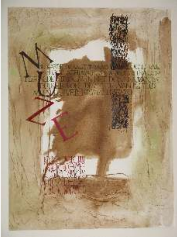
Corine doet ook graag aan kalligrafie en maakt daar gebruik van in haar werk.

onderlinge contacten tussen de leden. De eerste groep leden had een nauwe band met elkaar, ging zelfs samen schilderen in Frankrijk en zocht elkaar zelfs in de weekenden op om te praten over kunst en alles wat daarbij kwam kijken.